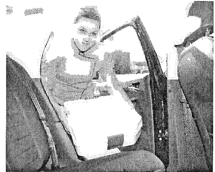
Das Essen ist bereit