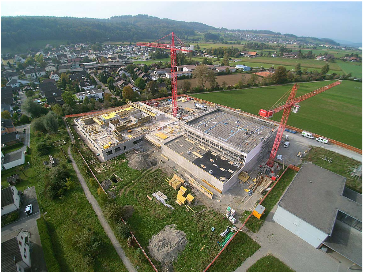
Schulzentrum Mühlematten im Bau